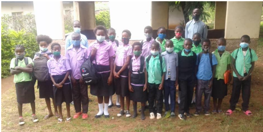
De twintig kinderen die het schooljaar 2021 op de reguliere school konden starten

Het schooljaar 2020 was in Zambia erg kort. Nadat de school begin januari was geopend, moesten de deuren 20 maart alweer dicht in verband met de corona-maatregelen. Pas op 21 september konden de kinderen weer naar school. In Zambia werd wel een onderwijskanaal op televisie geopend en werden e-learnings online gezet, maar voor de kinderen van de school in Isoka waren dat natuurlijk geen opties. Fijn was wel dat een paar dagen na heropening in september alle kinderen zich weer terug op school hadden gemeld. Sinds de heropening wordt zoveel mogelijk rekening gehouden met corona. De klassen zijn in tweeën gesplitst; de helft krijgt 's morgens les en de andere helft in de middag. Meer werk voor de leraren, maar op deze manier kunnen de kinderen afstand van elkaar houden. Ook worden mondmaskers uitgedeeld en wordt er gezorgd voor voldoende desinfecterende zeep om handen te wassen.