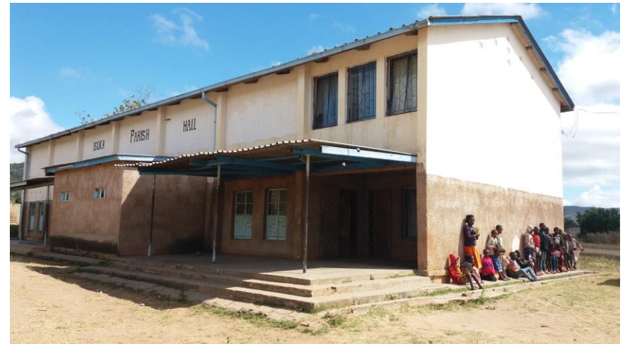
Het gebouw waar de kinderen nu les in krijgen.